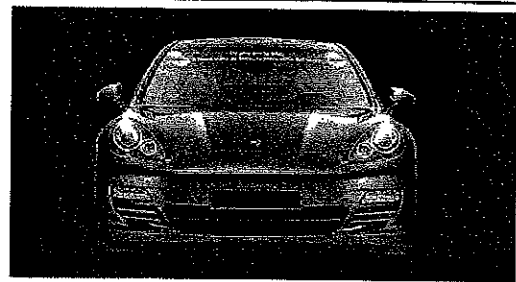
A sinistra la Panamera Hybrid su strada; sopra il frontale sportivo; a destra la barca a vela Sly 42 Fun